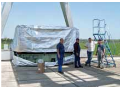
Balení, krok 2