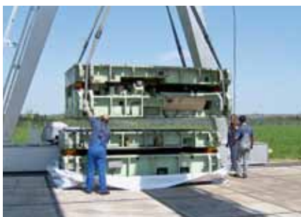
Balení, krok 1