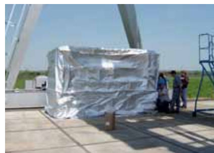
Balení, krok 3